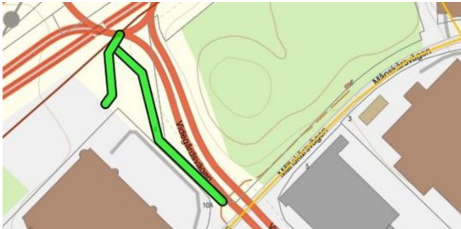
Ny gång- och cykelväg längs Videgårdsvägen (markerad med grön linje).