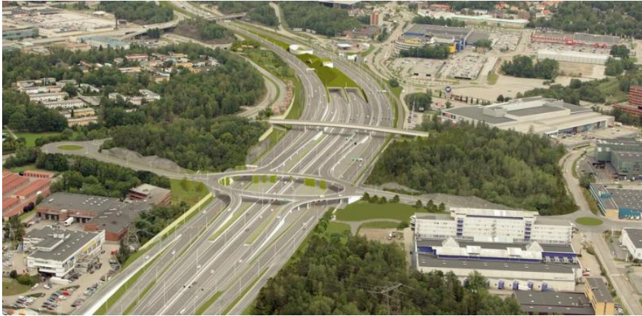
Den nya Trafikplats Lindvreten norra (illustration från Trafikverkets hemsida)