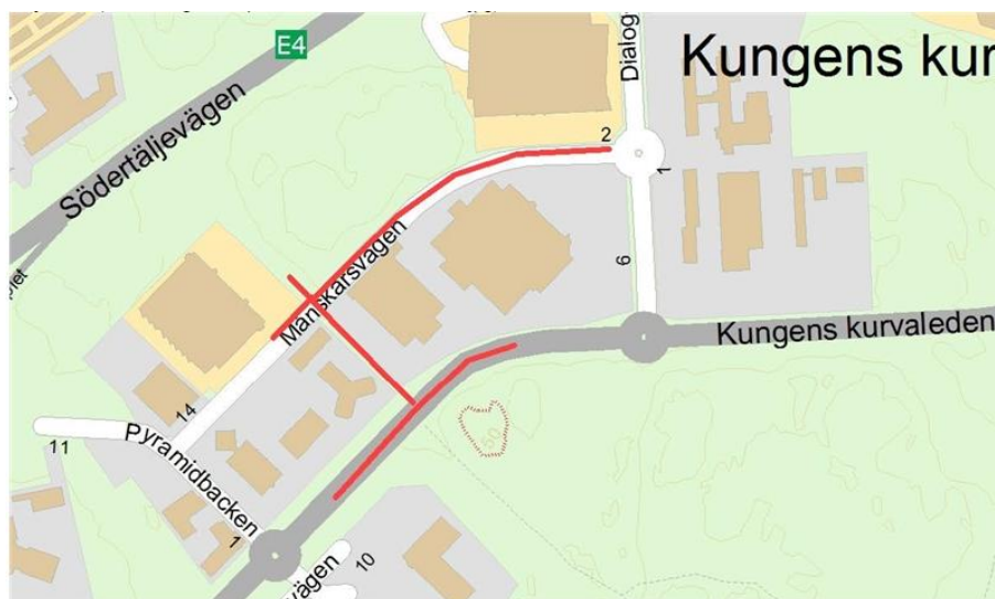
Videgårdsvägen och åtgärder på Månskärsvägen och Kungens kurvaleden (ma röd linje)

Kommunens åtgärder avser en ny gata mellan Månskärsvägen och Kungens kurvaleden samt anpassnings- och standardförbättringsåtgärder i befintliga gator; såsom nya korsningar, ny bussfil och cykelbana. Åtgärderna är genomförda och kostnaden uppgick till ca 97 mnkr.