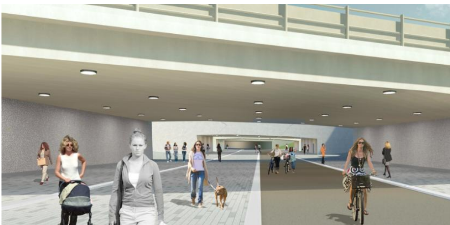
Gång- och cykeltunneln mellan Skärholmen och IKEA (illustration från Trafikverkets hemsida).

Huddinge kommunen ska vara ägare till och huvudman för tunneln. Kommunen har erlagt 10 mnkr för att höja standarden på den nya tunneln. Åtgärderna är genomförda.